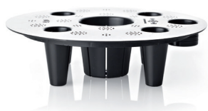
griglia divisoria delimita la riserva d'acqua separator forms the water reserve