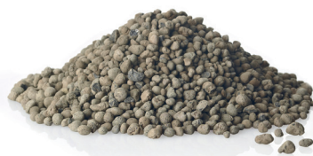
argilla espansa assicura una adeguata umidità al terriccio expanded clay ensures adequate moisture in the soil